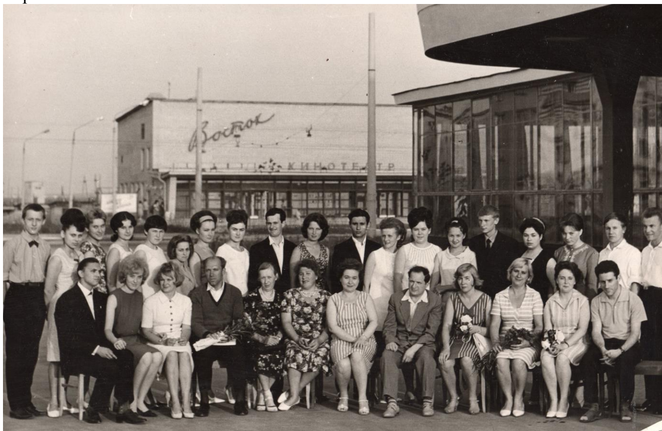
Выпуск 1966 года

Сейчас я считаю, что вполне реализовалась в рамках своих амбиций. Возможно все могло быть иначе, будь в моей семье другие семейные установки. Но я ни о чём не жалею: свой скромный вклад в культуру я делала искренне и по мере своих возможностей.